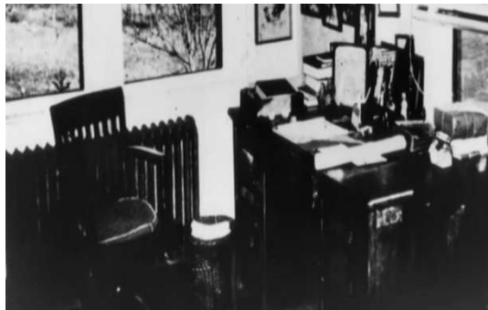
Lo studio di Edgar Cayce