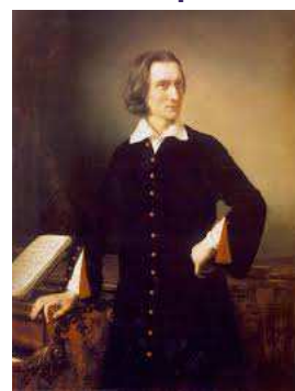
Franz Liszt ritratto da Miklos Barabas, 1847