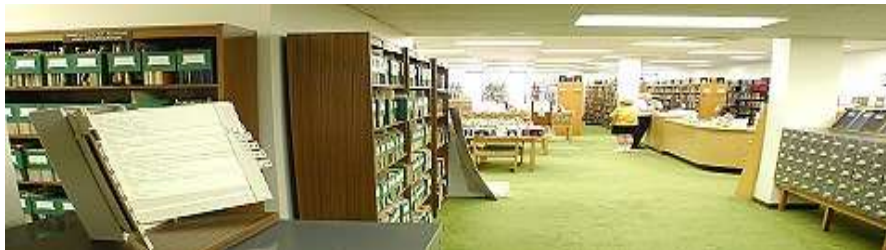
La biblioteca della sede dell'A.R.E.

Maria Antonietta” in LA NOSTRA SPIRITUALITA’ - Reincarnazione