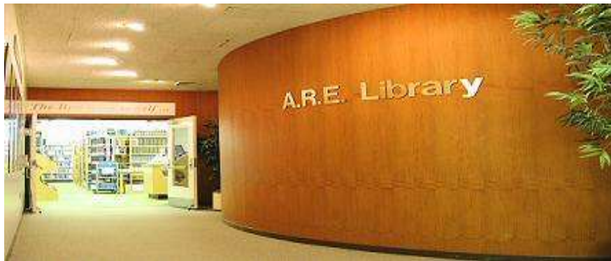
La biblioteca dell'ARE a Virginia Beach in Virginia (USA)

Chi è interessato a creare un centro olistico di Cayce scriva a: areitaly@libero.it