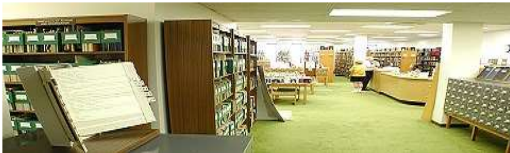
La libreria nella sede dell'A.R.E. a Virginia Beach, Virginia (USA)

"La reincarnazione di personaggi storici: Bruto" in LA NOSTRA SPIRITUALITA' - Reincarnazione