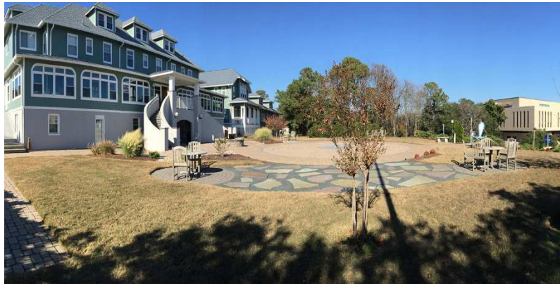
La sede dell'ARE a Virginia Beach in Virginia (USA)

Chi è interessato a creare un centro olistico di Cayce scriva a: areitaly@libero.it